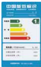
注：示意图表示该款冰箱能效等级为1级，属于节能冰箱。