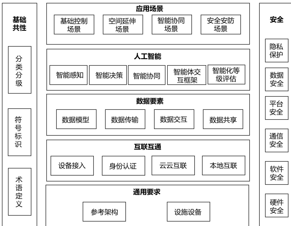
图 1 车家互联标准体系架构图

车家互联标准体系结构包括基础共性、通用要求、互联互通、数据要素、人工智能、应用场景、安全 7 个部分，主要反映标准体系各部分的组成关系。车家互联标准体系结构如图 1 所示。